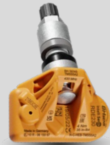
RDE-Original-Ersatzsensoren mit silbernem Metallventil RDV021