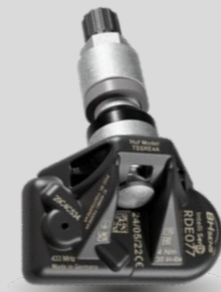
RDE-Original-Ersatzsensoren mit silbernem Metallventil RDV021