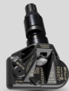
RDE-Original-Ersatzsensoren mit schwarzem Metallventil RDV026