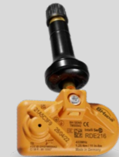
RDE-Original-Ersatzsensoren mit Gummiventil RDV041