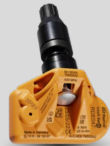
RDE-Original-Ersatzsensoren mit schwarzem Metallventil RDV026